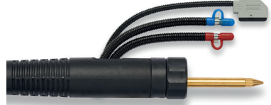
Zentralanschluss WFI - Wasser intern, (F-ZA) WFEX - Wasser extern, (F-ZA)