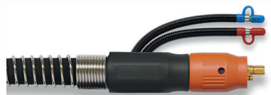
Zentralanschluss WZ-2F (Euro-ZA) passend zu den meisten marktgängigen Geräten